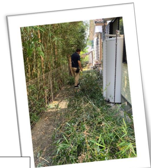
スッキリしました。(^^)😊