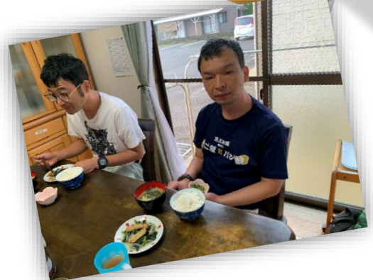
ホームでの様子です。健脚も再開し、ラジオ体操も朝夕の運動に取り入れました。