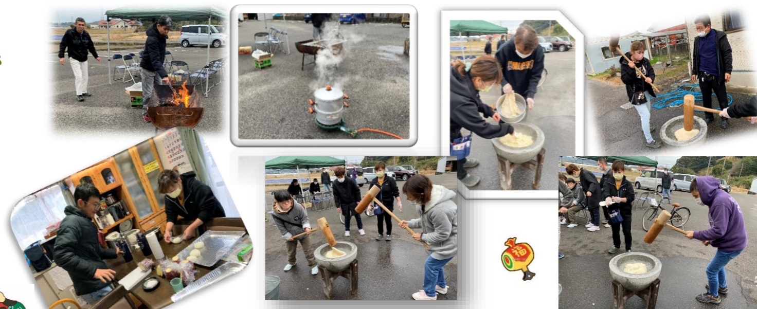
12月29日レクリエーション(餅つき・焼肉を男性ホーム前の駐車場で行いました。)

あけましておめでとうございます。本年もよろしくお願い申し上げます。おかげさまで昨年の年末の帰省は予定通り実施することができました。帰省された利用者の皆さんは久しぶりの我が家でゆっくり過ごすことができたと思います。ご家族の皆様のご協力ありがとうございました。また、帰省されていない利用者の皆さんもホームで世話人の手料理を美味しくいただき、お正月休みを過ごすことができました。さて、今年は何んな年になるか楽しみです。新型コロナウイルス感染症の不安もありますが、スタッフ一同、利用者の皆さんが良い年になるよう精一杯の支援を行います。