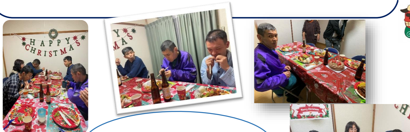
12月24日に各ホームで行いましたクリスマス会の様子