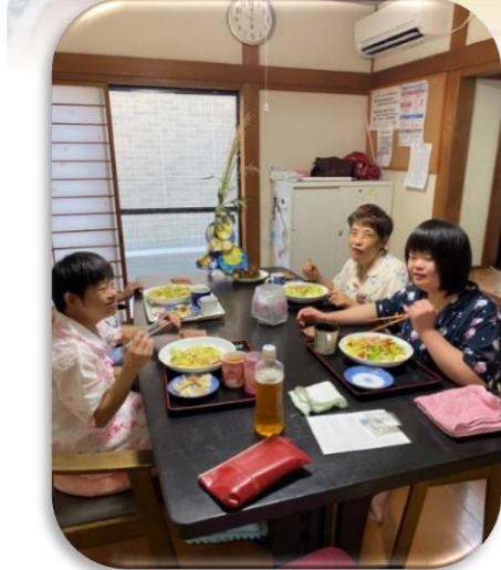
十五夜の日には夕食にデザートが出ました。