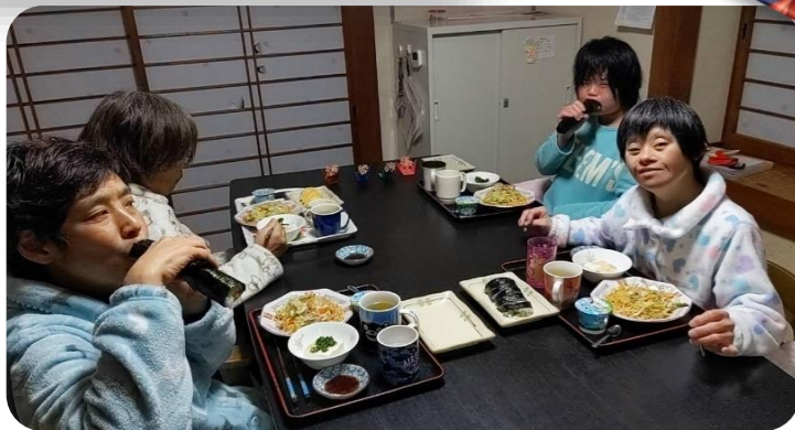
節分に恵方巻を食べました。 とてもおいしかったです。