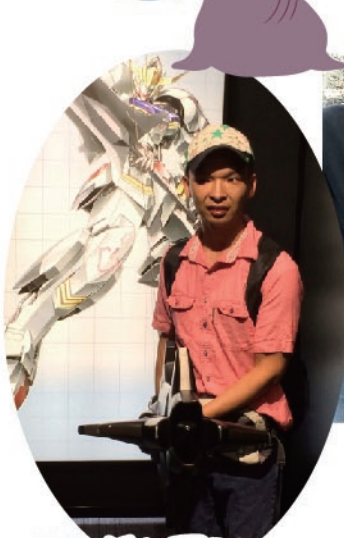
ガンダム展に 行ってきました。