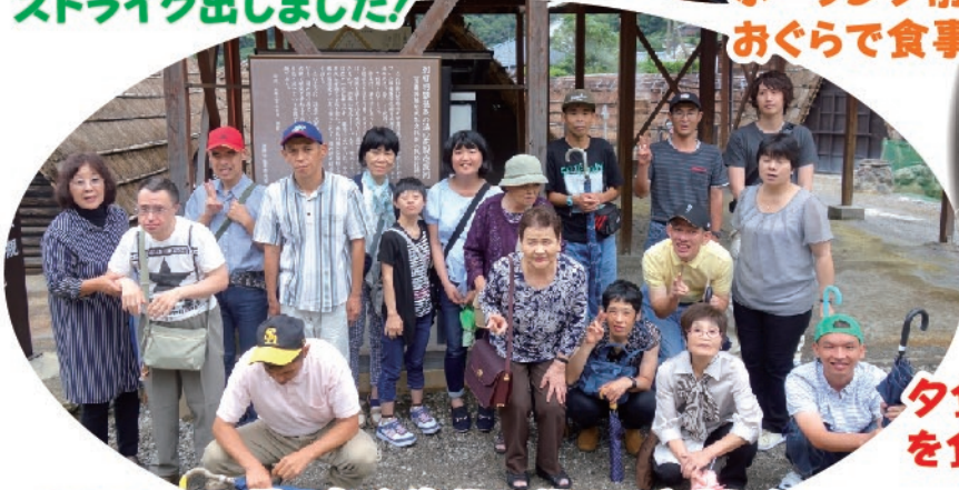
7月、大分旅行に行ってきました。 うみたまごとアフリカンサファリに行き、 楽しみました。