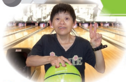
ボーリングレクリエーション♪ ストライク出しました!