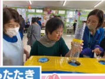
②ジャングルカーニバル