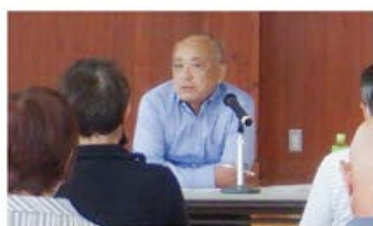
【定例会 黒木会長より行事報告】