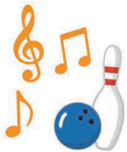
11月・やまびこ祭 ボーリング外出の様子