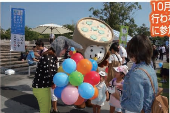
10月・メディキット県民文化センターで行われました「こころのふれあうフェスタ」に参加しました。