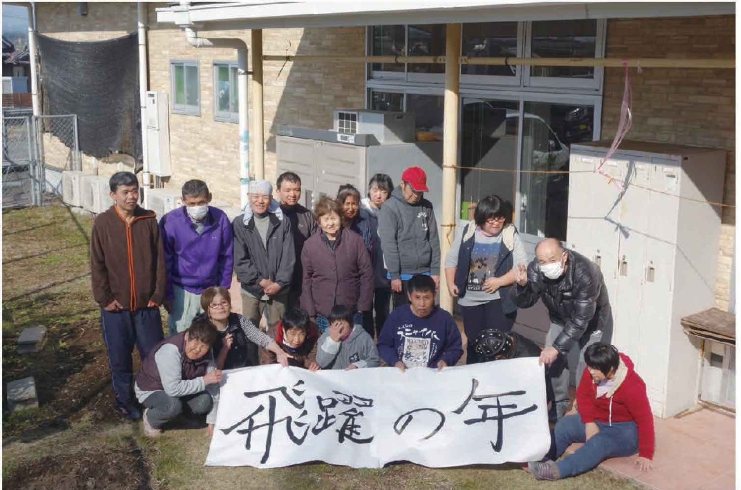
令和2年1月はんぴどん中庭にて