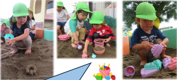
新しい砂場セットで遊ぶのたのしいな~