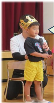
な り ま す す ぐ 4 歳 に