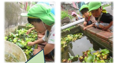
お魚さんいませんか?