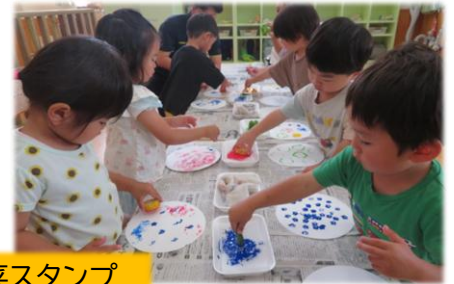
やさいのおなかで、野菜スタンプ! 楽しいな~!!