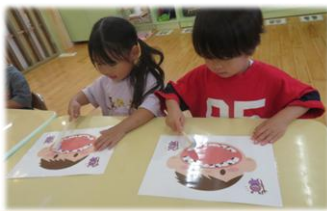
6月4日は虫歯予防の日