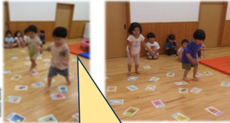
「つき」のカードみつけ!!