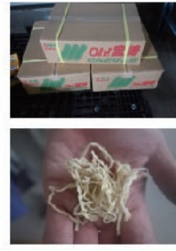
就労先のJA宮崎中央総合選果場(田野町)