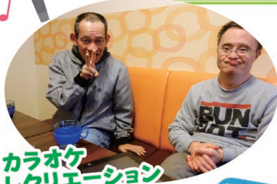
カラオケ レクリエーション