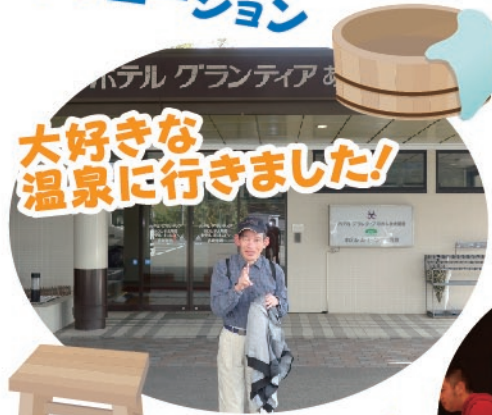
大好きな 温泉に行きました!