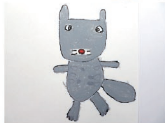
絵 井上 智重子