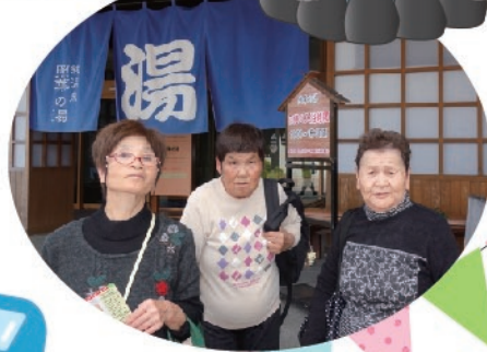
温泉レクリエーション