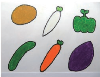
絵 竹下 靖一