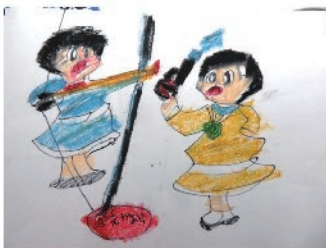
絵 宮元 香織