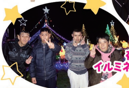
夜間 イルミネーション