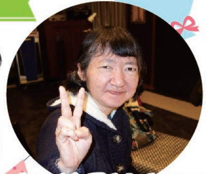
新しく入居されました!