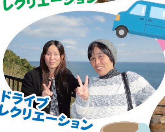
ドライブ レクリエーション