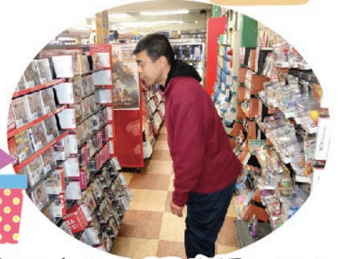
お気に入りのCDを買いに♪